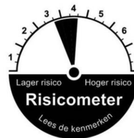
Gematigd defensieve portefeuille aanbieder B