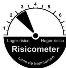
Conservatieve portefeuille aanbieder A